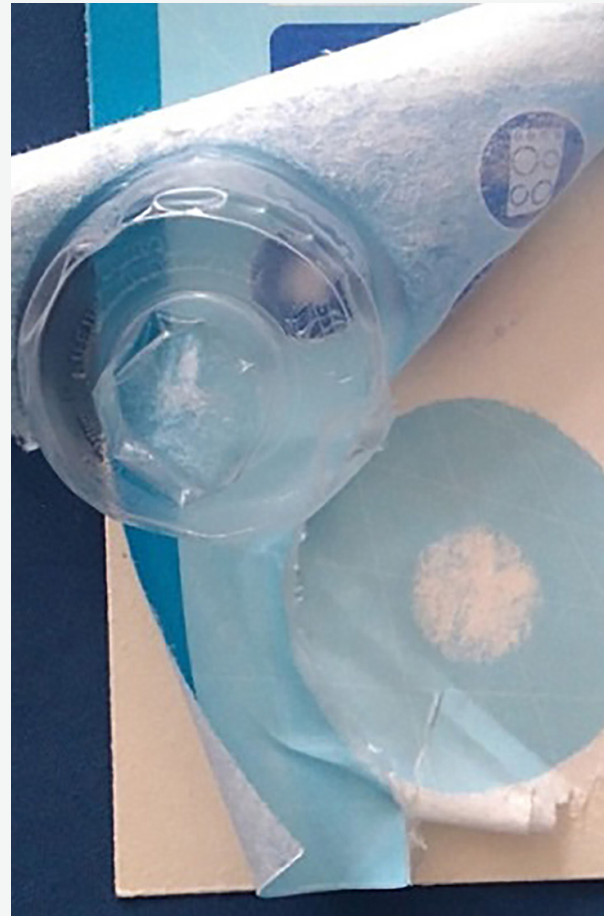
Fot. 2. Opakowanie typu skin pack po próbie rozdzielenia materiałów (na folii widoczne są liczne włókna celulozowe)