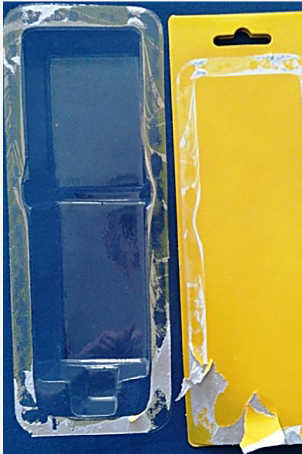
Fot. 1. Opakowanie typu blister pack po próbie rozdzielenia materiałów (na folii widoczne są liczne włókna celulozowe)